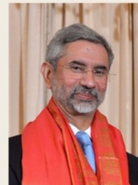
Министр иностранных дел Индии- Субраманьям Джайшанкар

Следовательно, необходимо найти оптимальное решение для проблем логистики .