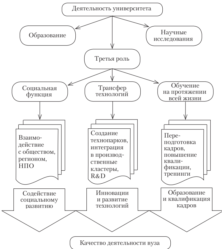
Интерпретация третьей роли университетов на современном этапе

Несмотря на вариативность содержательного наполнения и наличие локальной специфики, содержание третьей роли может быть структурировано исходя из принципов функционального подхода. Третья роль вуза включает такие базовые компоненты, как передача технологий (technology transfer), социальные обязательства (social engagement) и обучение в течение всей жизни (lifelong learning). Системное соотношение компонентов и их включенность в общий контекст деятельности вуза можно проиллюстрировать следующей схемой.