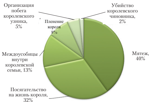
Диаграмма 2. Предательство, совершенное по отношению к королю и членам королевской семьи

Прежде всего попытаемся разобраться, какие действия, идущие вразрез с интересами короны, автор «Новых хроник» расценивал как предательство. Так как число таких случаев довольно велико (60 прецедентов), для удобства восприятия данные также имеет смысл представить в форме диаграммы (диаграмма 2).