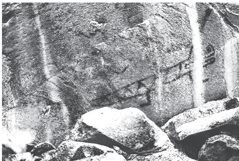
Рис. 4. Изображение крокодила в области В Гватемала, деп. Сакатепекес. 10–24 марта 2019 г.