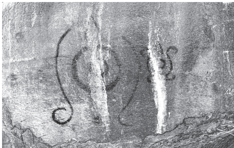
Рис. 5. Два изображения черепах (?) в области Е Гватемала, деп. Сакатепекес. 10–24 марта 2019 г.

Кроме того, стоит отметить тот факт, что среди всего массива на- скальных росписей Ла-Каса-де-лас-Голондринас можно выделить большую группу зооморфных изображений, которая включает в себя изображения обезьян, опоссума, собак, ящериц, птиц и др., а также земноводных и пресмыкающихся, упоминавшихся выше. Однако отсутствуют изображения рыб, кроме одного схематичного рисунка в области А, который может быть стилизованным изображением рыбы. Отсутствует и такой распространенный в Мезоамерике и других регионах мотив, как изображение воды (дождя или водоема) в виде волнистых линий. Среди корпуса рисунков есть одно изображение волнистых линий, однако оно больше напоминает рисунок дыма или нечто абстрактное, нежели изображение воды. Отмечен еще один рисунок, интерпретация которого является спорной – это антропоморфное изображение, возможно, божества, справа от большой группы животных в области А. Дж.В. Палка предполагает, что его можно идентифицировать как Тлалока 10 .