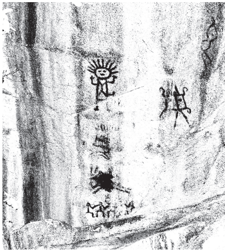
Рис. 3. Группа изображений, включающая в себя антропоморфный рисунок и изображение краба Гватемала, деп. Сакатепекес. 10–24 марта 2019 г.

изображение антропоморфного улыбающегося божества с аналогичным головным убором было обнаружено среди петроглифов памятника Лас-Лабрадас, который находится на побережье Тихого океана в северо-западной части Мексики – в 2000 км от Ла-Каса-де-лас-Голондринас. Памятник расположен в штате Синалоа, между реками Пресидио и Сан-Лоренсо, в 29 км севернее тропика Рака. На археологическом памятнике Лас-Лабрадас находятся сотни базальтовых камней, на которых выгравировано более 700 петроглифов. Среди изображений встречаются антропоморфные, зооморфные, фитоморфные и геометрические фигуры, а также солярные и абстрактные символы. Как минимум 50 из них археологи относят к наиболее древнему периоду – 8000–7000 гг. до н. э. 4 Среди антропоморфных изображений несколько раз встречаются фигуры улыбающихся людей с поднятыми руками и головными уборами в виде расходящихся линий (возможно, таким образом изображены волосы). Некоторые исследователи относят данные рисунки к солярным символам. Кроме того, среди петроглифов Лас-Лабрадас встречаются изображения лягушек и крокодила.