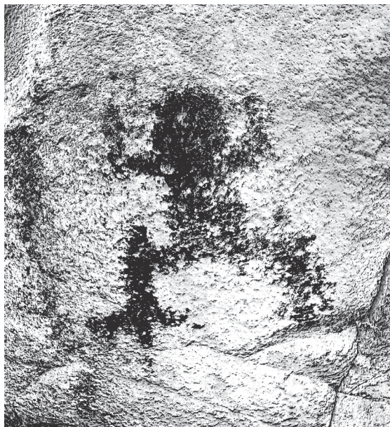
Рис. 2. Изображение лягушки рядом с отверстием для астрономических наблюдений Гватемала, деп. Сакатепекес. 10–24 марта 2019 г.

В майяском искусстве изображения лягушек встречаются достаточно часто, в том числе фигурки лягушек были обнаружены среди погребального инвентаря. Стоит отметить, что данные захоронения находятся недалеко от водоемов. Одна из фигурок лягушек происходит из богатого захоронения на острове Топоште (озеро Йашха, Гватемала). Она изображает плывущую