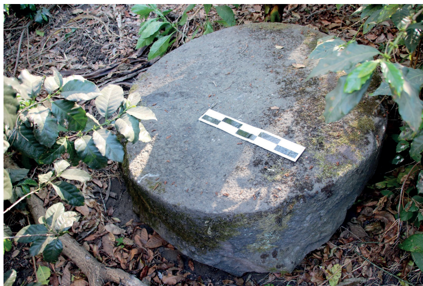
Рис. 1. Каменный алтарь, обнаруженный рядом с наиболее крупным источником воды Гватемала, деп. Сакатепекес. 10–24 марта 2019 г.

Большинство росписей Ла-Каса-де-лас-Голондринас представляют собой абстрактные изображения, однако можно выделить группу рисунков (14 шт.), имеющих отношение к водным символам. В основном это изображения земноводных и пресмыкающихся-