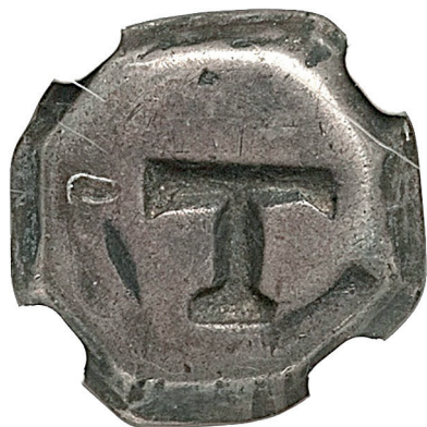
Рис. 4. “Т-bit” о-ва Тринидад. Изображения взяты из каталога Numista [Электронный ресурс]. URL: https://en.numista.com/ (дата обращения 08.01.2023)

тельный барбадосский пенни, выпущенный по инициативе местного плантатора и циркулировавший на внутреннем рынке острова, или серебряные монеты, вырезанные из стандартных песо на Тринидаде (см. рис. 4). Эти округлые кусочки монеты со специальной отметкой «Т» составляли 1/9 массы целого песо и имели стоимость 1 шилл. 25 , что было сделано специально для удобства денежных расчетов. Такая монета, в отличие от медной, имела определенный успех в том числе и благодаря тому, что была сделана из ценного металла. Прекращение ее использования было вызвано участившимися подделками, и в 1823 г. “Т-bits” 26 , как их называли в то время, были запрещены, хоть впоследствии губернатор острова признал полезность и удобство этих денег.