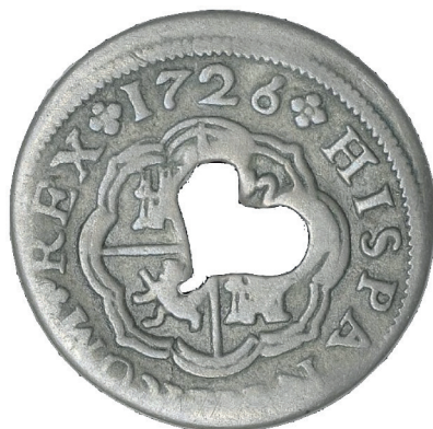
Рис. 2. Монета Мартиники с вырезанной центральной частью

получить из нее пять кусочков, которые по виду и стоимости соответствовали бы четвертой части 17 .