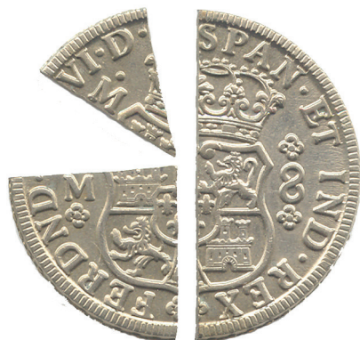
Рис. 1. Песо, разделенное на части. Изображение взято из свободного поиска в сети Интернет