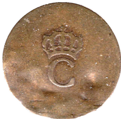
Рис. 3. Французский “Stampee”