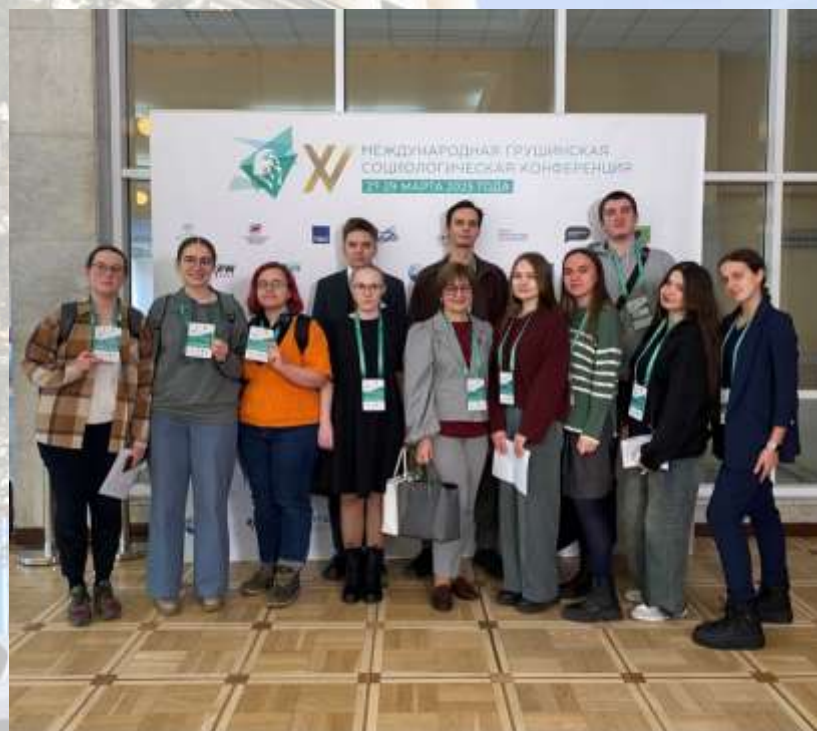
Грушинская конференция ВЦИОМ