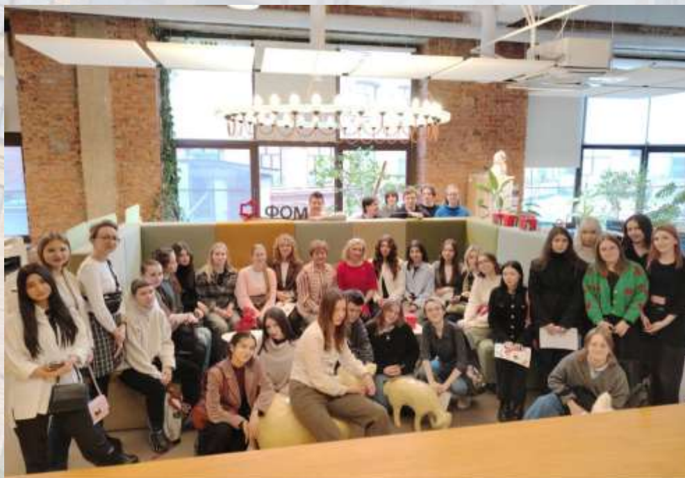
Фонд «Общественное мнение»