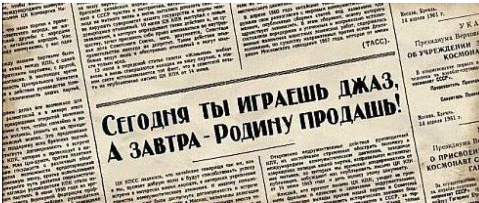
Советские публикации о джазе. Материалы газет «Правда», «Известия», «Советская музыка».