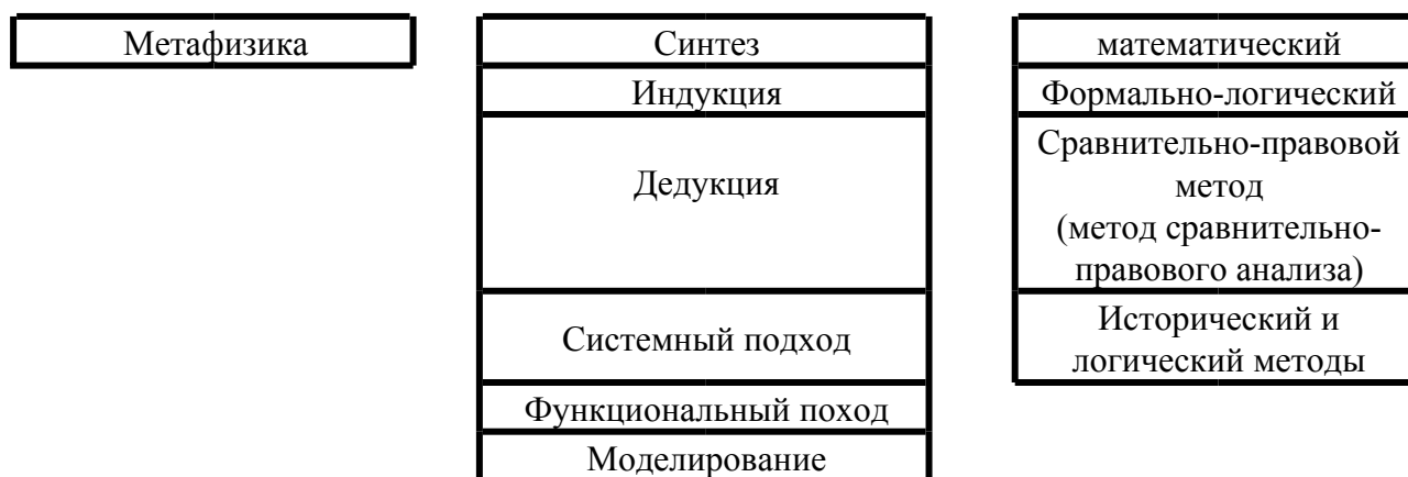
Рисунок 1 – Методы научного исследования