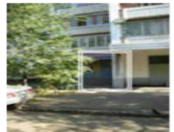
Рис. 4. Месторасположение парикмахерской

Собственнику желательно создать поток посетителей хотя бы 150 человек в неделю. Ассигнования, выделенные собственником на продвижение парикмахерской – не более 100 000 рублей. На той же улице четыре месяца назад открылась парикмахерская-конкурент на 4 посадочных места. Никаких услуг, кроме стрижки, не оказывают. Помещение крохотное, люди ждут своей очереди прямо в салоне. Работают 18-летние гастарбайтеры из Молдовы и Украины.