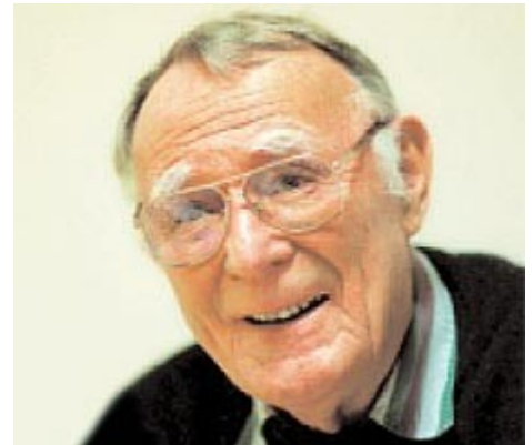
Основатель ИКЕА Ингвар Кампрад

Предлагаемая продукция имела четкие дифференцирующие черты. Все было простым, качественно сделанным, по-скандинавски элегантным. Все продавалось в разобранном виде для самостоятельной сборки покупателями, что снижало цену и срок доставки из магазина (чем отличаются другие мебельные фирмы). Огромные пригородные магазины имели огромные парковки, рестораны, детские игровые комнаты, инвалидные кресла и т.п. Покупатели ожидали стиля и качества по разумным ценам. ИКЕА реализовала эти ожидания, предоставляя покупателям возможности самостоятельного создания ценности путем исполнения функций, традиционно отдаваемых производителю или продавцу: например, доставка и сборка. Разумеется, это также снижало издержки. Также на это работало и то, что покупателям в торговом зале выдавались бумажные «метры», карандаши и блокноты для записей – требовалось меньше продавцов.