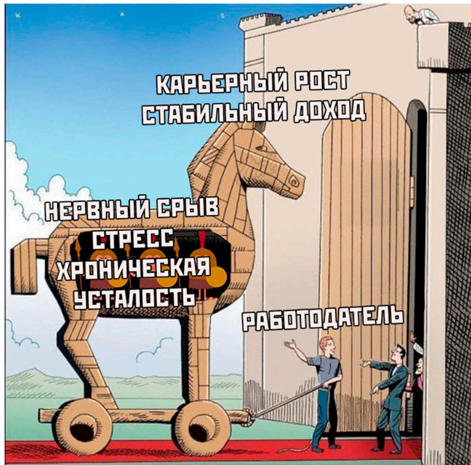
Рисунок 7. Интернет-мем «Троянский конь»