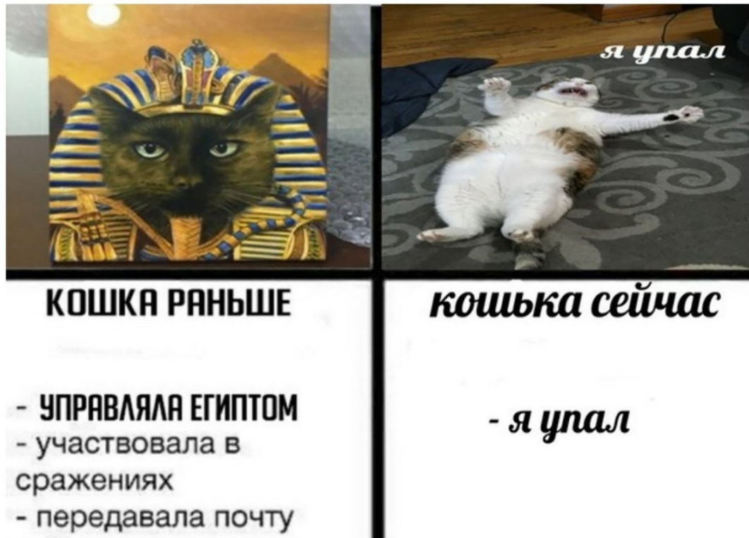
Рисунок 4. Интернет-мем «Раньше/сейчас»