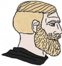
Рисунок 2. Неизменяемая часть интернет-мема «Парни с машиной времени»