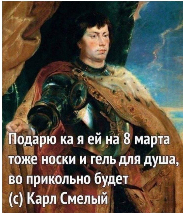
Рисунок 6. Интернет-мемы из «Страдающего Средневековья»