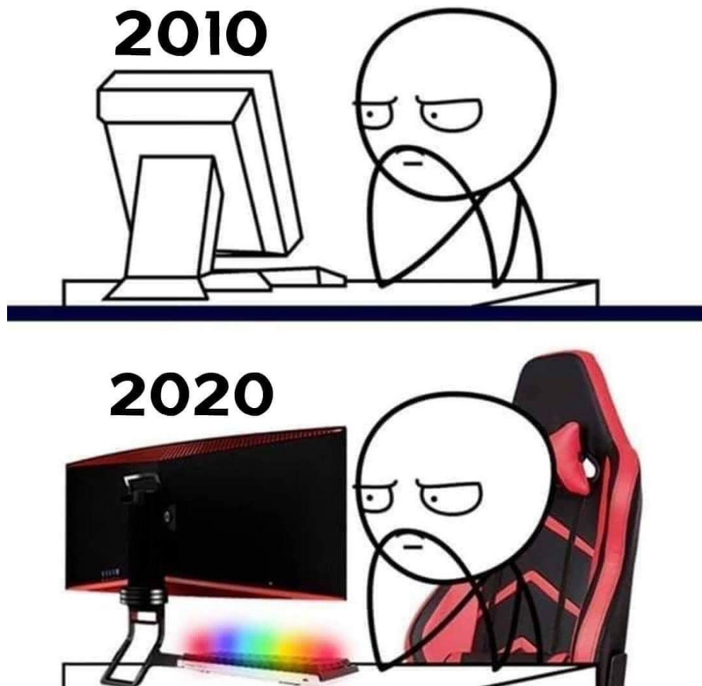
Рисунок 5. Интернет-мем «Человек за компьютером»