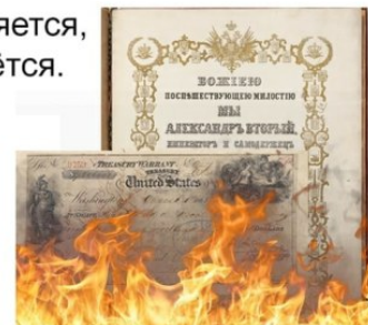
Рисунок 3. Пример репликации интернет-мема «Парни с машиной времени»