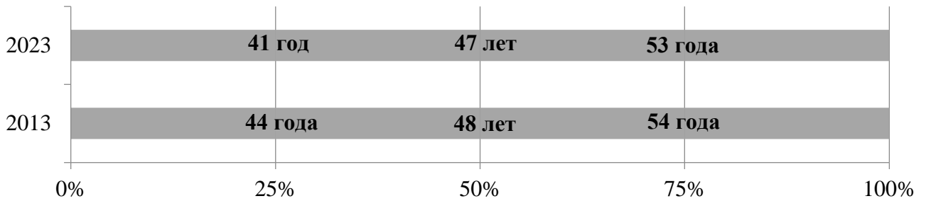
Рисунок 3. Возраст представителей регионального сегмента политической элиты в разбивке по 4-м одинаковым квартилям (n=83 (2013) и n=89 (2023))

Наибольшая динамика изменений отмечена в 1-м квартиле, что говорит о возросшем числе назначений относительно молодых руководителей на должности глав регионов. Кроме того, в 2023 году доля молодых губернаторов, которым на момент назначения был 41 год и менее (1-й квартиль) значительно чаще имеют опыт работы в рамках исполнительных органов федерального уровня (32%).