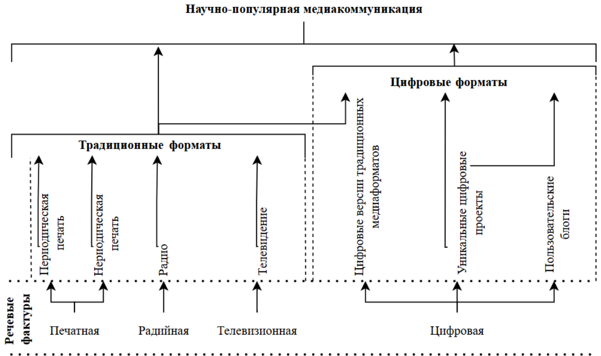
Рисунок 2. Типология форматов научно-популярной медиакоммуникации (авторская разработка)

Ключевые особенности блога как общего формата, которые наследуются различными его вариациями: структурированная иерархия веб-сайта с наглядным расположением новых сообщений пользователя; простая процедура регистрации новых пользователей; возможность комментирования опубликованных сообщений другими пользователями; возможность «подписки» на интересующих пользователей 18 .