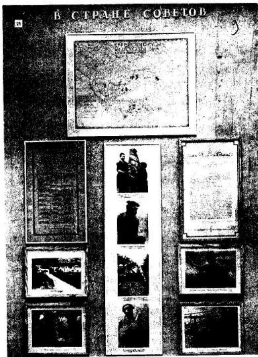
Фото 5. Щит «В Стране Советов» на выставке «Евреи в царской России и в СССР».