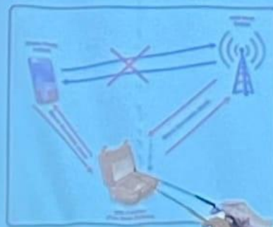
Фемтосоты и GSM-ловушки