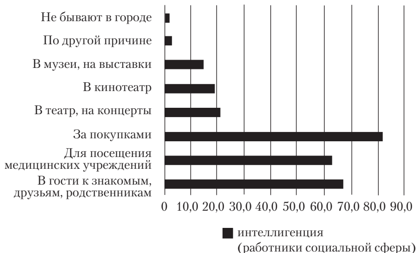
Рис. 1. Распределение ответов на вопрос: «Если Вы ездите в город, то с какой целью?» (в % от числа ответивших, сумма ответов больше 100%, так как респонденты имели возможность выбора нескольких вариантов ответа)